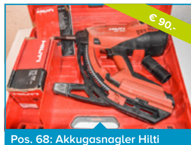
Pos. 68: Akkugasnagler Hilti