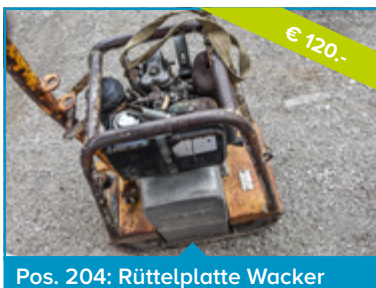
Pos. 204: Rüttelplatte Wacker