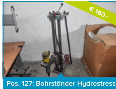
Pos. 127: Bohrständer Hydrostress