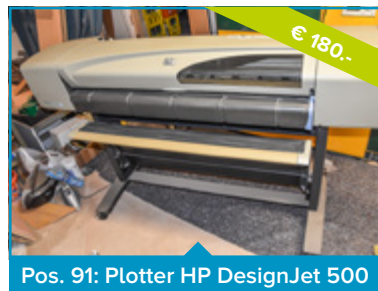
Pos. 91: Plotter HP DesignJet 500