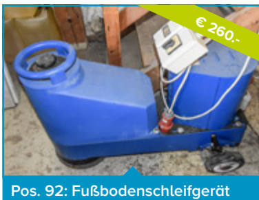
Pos. 92: Fußbodenschleifgerät

Endend am 09.12. ab 09 Uhr auf www.aurena.at